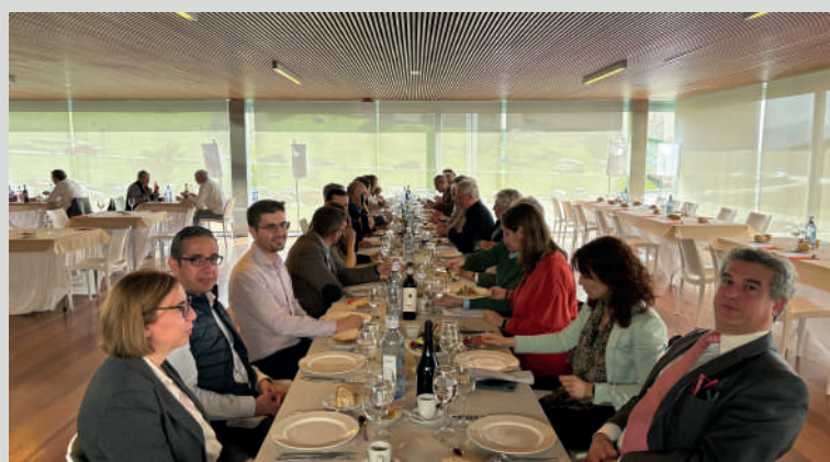
Asistentes durante la comida.

Los asistentes disfrutaron del almuerzo en el restaurante Lienzo Norte y visitaron las distintas dependencias del Centro de Exposiciones.